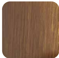
22. Laiton bruni