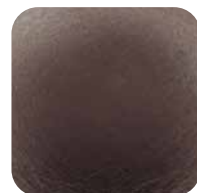
89. Brun velours PVD