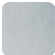
28. Laiton chromé mat