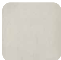
25. nickelé poli