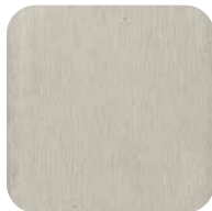
23. Laiton nickelé mat