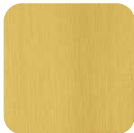
21. Laiton brossé mat

Les finitions suivantes sont disponibles du stock.