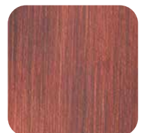
32. Cuivre antique