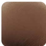
75. Cuivre satiné PVD