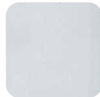
26. Laiton chromé poli

Les finitions suivantes sont disponibles sur commande avec un délai de 4 semaines.