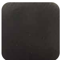
74. Anthracite PVD