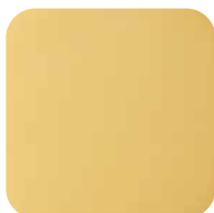
20. Laiton poli